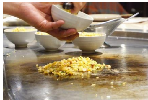
香港での営業後採用されたメニュー