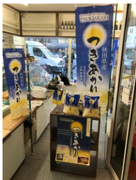
プロモーションを実施した際の様子・日本産米使用をPRする販促資材